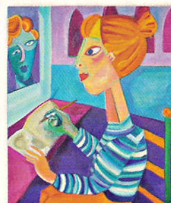
VROU SCHRIJVEND I, OLIEVERF OP DOEK 100 X 80 CM € 1850,-