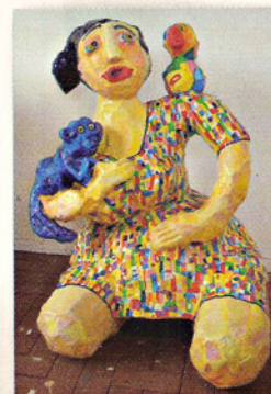
VROU MET VOGEL EN AAP 120 X 80 X 70 CM POLYESTER (GESCHIKT VOOR BUITEN)