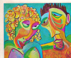
VERLEGEN, ACRYLVERF OP DOEK 100 X 80 CM € 1995,-