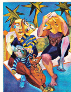
ZONDAG, OLIEVERF OP DOEK 150 X 130 CM € 2900,-